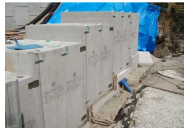
断面変化部への適用